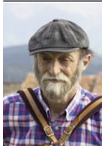
Pep Lizandra i Micó, acordionista i mestre de danses

Aquest tipus de danses han tingut els seus temps de prohibicions i de glòria, segons el moment polític i la permissibilitat de cada època.